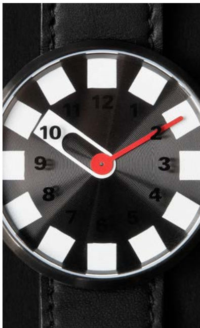
Watch3 black dial Watch3 black Zifferblatt