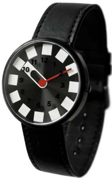
Watch3 black Watch3 black