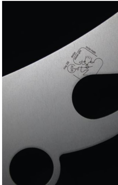
stag200 with laser engraved logo and serial number 25/25

Stag280 mit lasergravierter Seriennummer 02/25