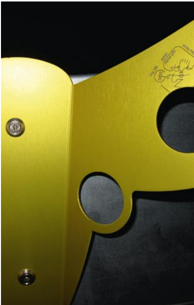
stag280 with laser engraved logo and serial number 02/25

Stag280 mit lasergravierter Seriennummer 02/25