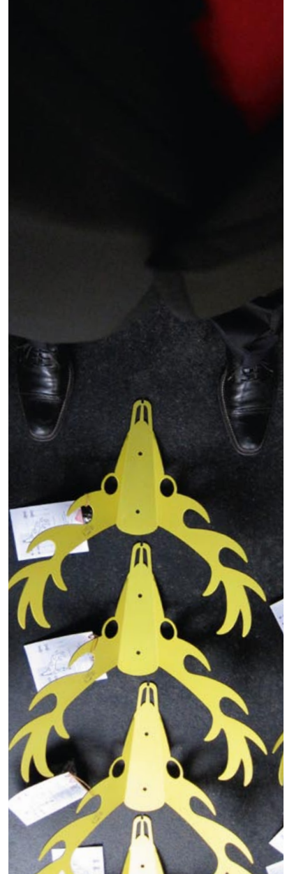
Made by fairly paid adults in Switzerland for people who have a sense for clothes and a sense of humor

Stag200 mit lasergravierter Seriennummer 25/25